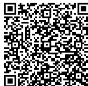
Abbildung 1 1-D Barcode (oben) - 2-D Barcode (unten)